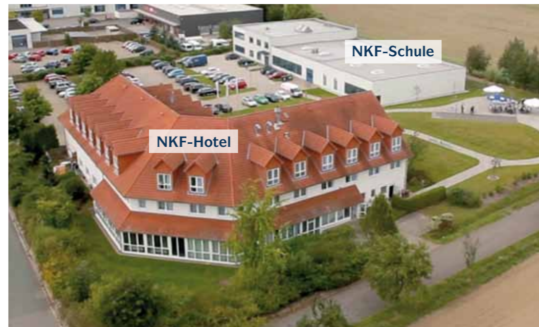
Sitz der Landesinnung Kälte-Klimotechnik in Springe